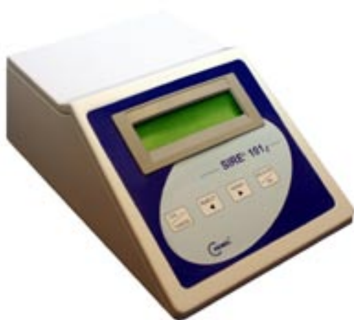
Bilden illustrerar Chemels nuvarande laboratorieinstrument SIRE® 101e som bygger på bolagets egenutvecklade biosensorteknik. Försäljning av har skett både inom Sverige samt internationellt.