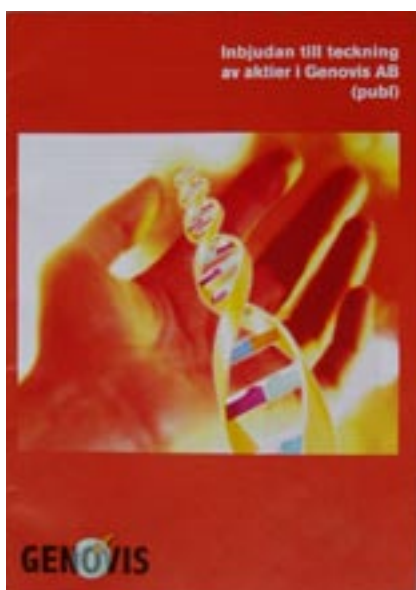
Bilden illustrerar Genovis nyemissionsprospekt som distribuerades till aktieägarna och allmänheten under mars 2006. Den övertecknade nyemissionen inbringade 10,1 Mkr.