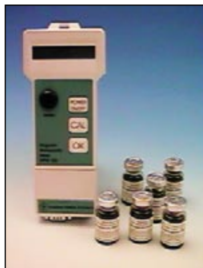
European Institute of Sciences specialprodukter för kunder inom forskning och utveckling. På bilden syns ett mätinstrument för magnetisk permeabilitet (MPM 100) samt forskningskemikalier i form av magnetiska nanopartiklar.