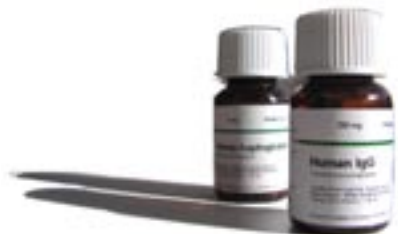
Bolaget lanserade två nya produkter för forskningsbruk under 2005. På bilden syns biokemikalerna humant IgG samt Haptoglobin.

Vidare är målsättningen att Bolaget från och med verksamhetsåret 2006 skall uppvisa ett självgenererande positivt kassaflöde och en långsiktig årlig tillväxt.